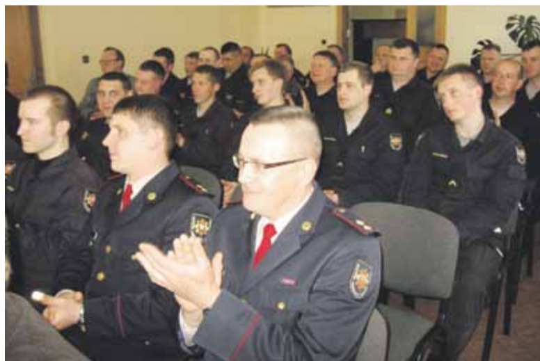
Ugniagesiai minėjo profesinę šventę.