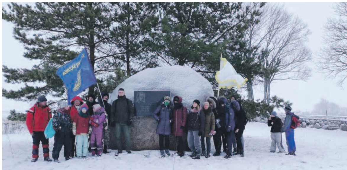
Žygio, skirto A. Smetonos žūties sukakčiai atminti, dalyviai.

Šiemet sausio 9-ąją sukako 75 metai nuo Lietuvos Prezidento Antano Smetonos žūties JAV. Sovietų sąjungai okupavus Lietuvą į emigraciją pasitraukęs pirmasis mūsų šalies vadovas žuvo Klivlendo mieste per namuose mįslingomis aplinkybėmis kilusį gaisrą.