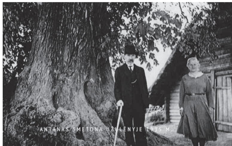
Antanas Smetona Užulėnyje 1935 m.