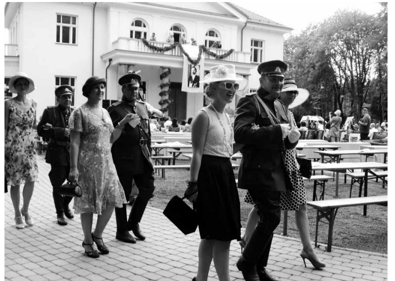
Tradicionis Užugirio dvare kasmet vykstančių Smetoninių akcentas – gražiausios ponios rinkimai.

Prezidentui atvažiavus į kaimą vaikai stovėdavo šalia kelio ir jis jiems pro langą barstydavo saldinius. Sutinkant A. Smetoną būdavo statomi „bromai“ – išstos konstrukcijos, apipintos ažuolo vainikais. Šalies vadovo vizitai kaimo būdavo didelė šventė, žmonės jį labai mylėjo.