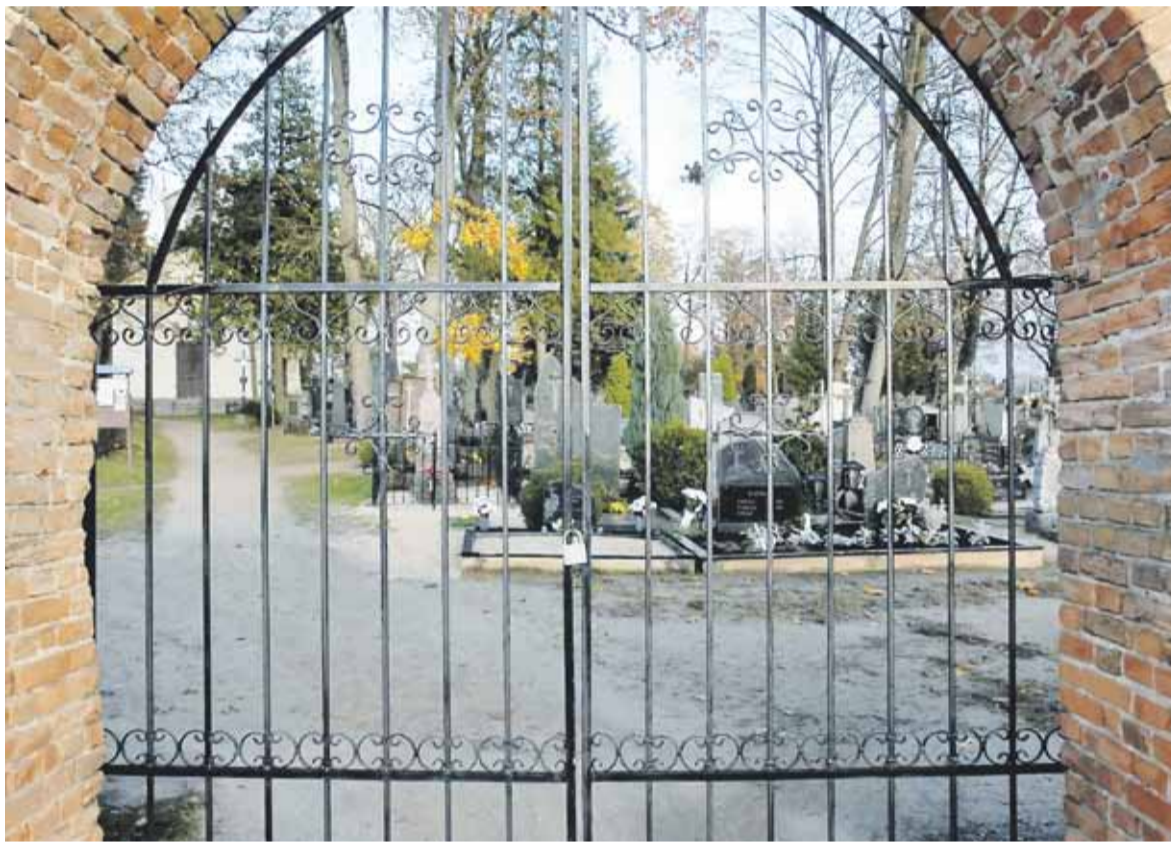
Per Vėlines kapinės nušvis nuo žvakelių.