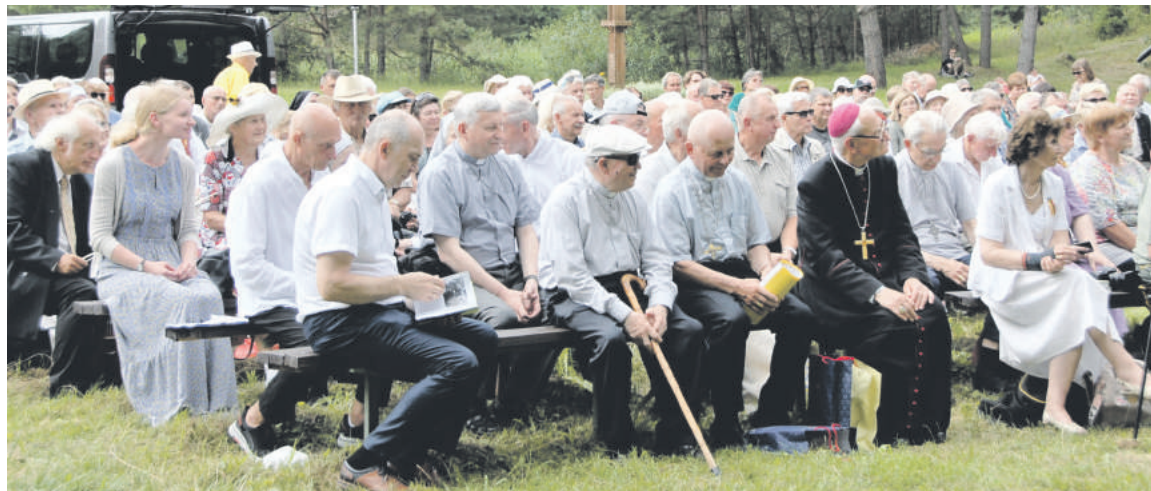
Šventė vyko Didžiosios Kovos apygardos partizanų parke.