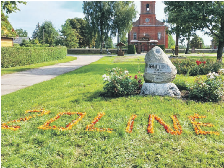
Pati svarbiausia Žemaitkiemio šventė – Žolinė.