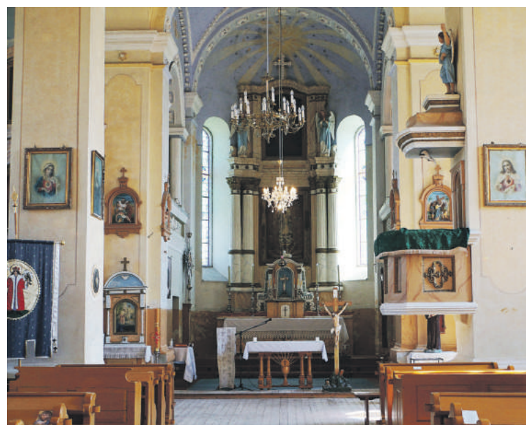
Bažnyčia atvira tikintiesiems.

„Beveik kiekvienais metais Žolinės švęsti važiuoju į gimtą parapiją – Pažerūs Kauno rajone. Siemet pavyko apsilankyti