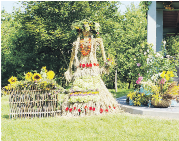
Žolinės atlaidų akimirkos.