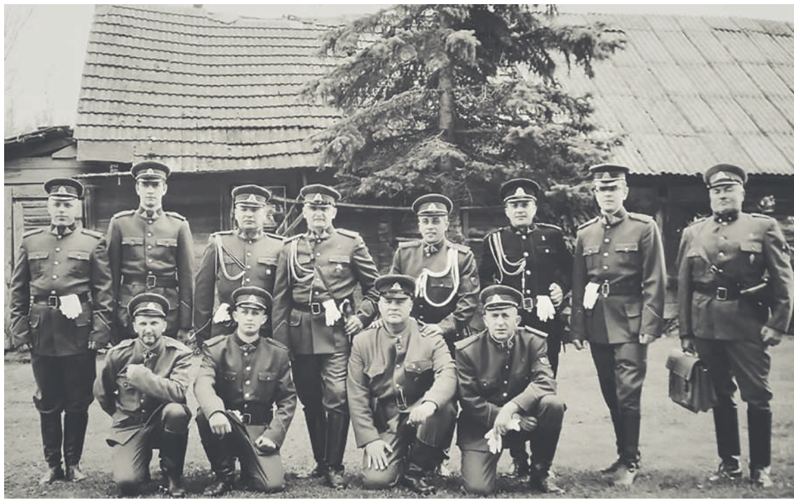
Vyčio ir Didžiosios Kovos apygardų kovotojai itin aršiai priešinosi sovietiniams okupantams.

Jau sudėliota šiemet Ukmergės rajone pirmą kartą vyksiančio Ekstremaliosios muzikos festivalio „Kilkim Žaibu“ programa.