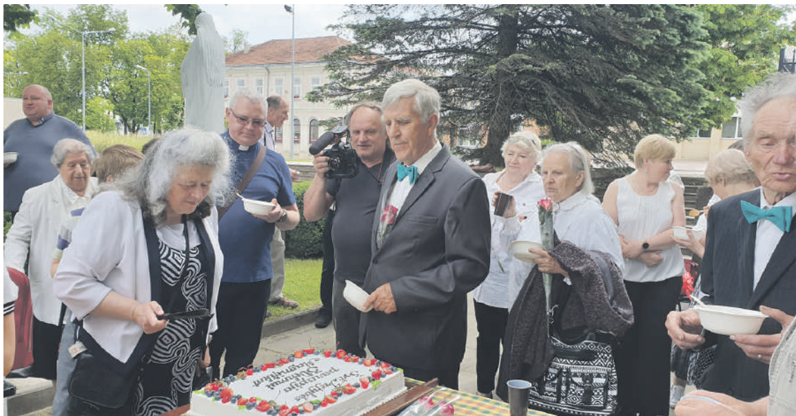
Šventės dalyviai pakviesti į agapę.

buvo priimtas sprendimas grąžinti pastatą tikintiesiems. Po mėnesio buvo aukojamos pirmosios Mišios. Kūrimasis užtruko apie metus. Buvo kuriami „Caritas“, choras ir kitos organizacijos. Todėl mums visi metai buvo šventiniai,