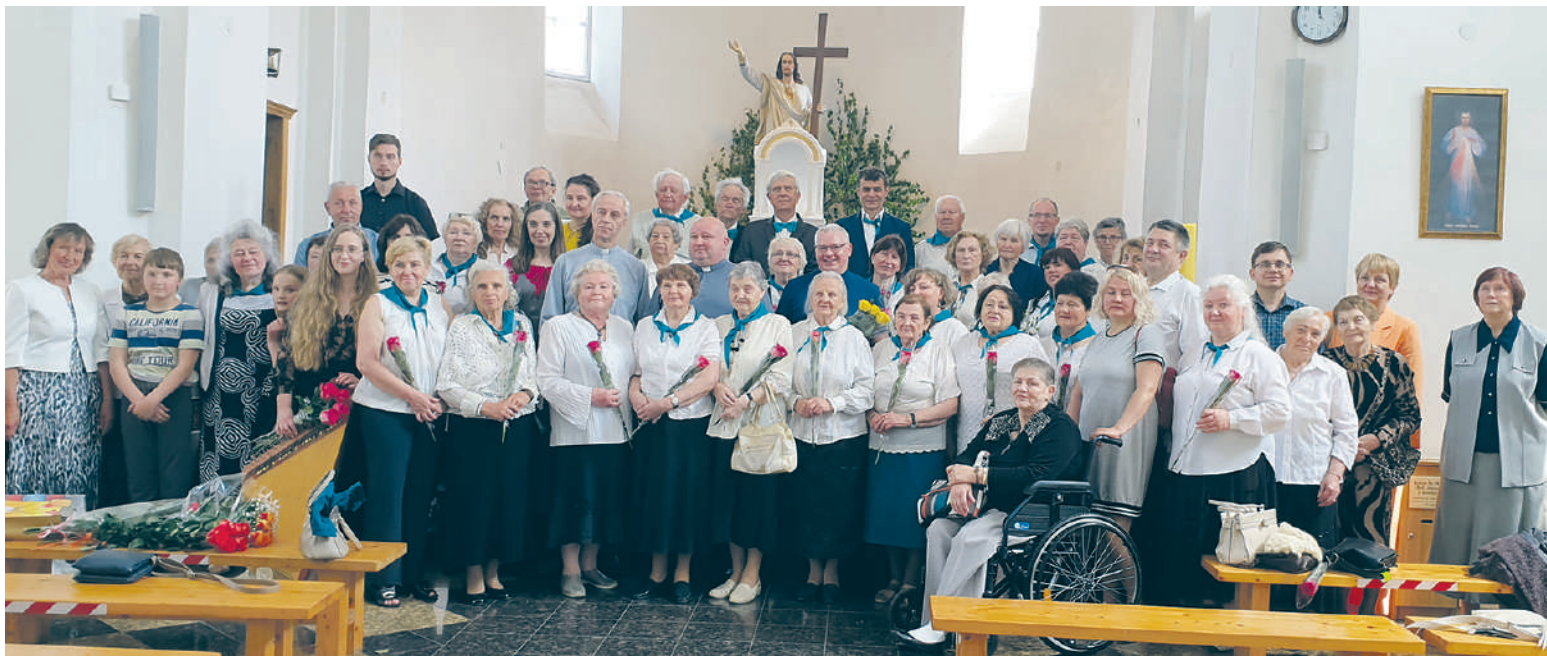
Bendroje nuotraukoje – choras ir parapijos tikintieji.

Bėgant metams bažnyčioje giedantis choras „Magnificat“ dalyvavo įvairiuose muzikiniuose renginiuose, koncertavo Lietuvos bažnyčiose, bažnyntinių chorų bei