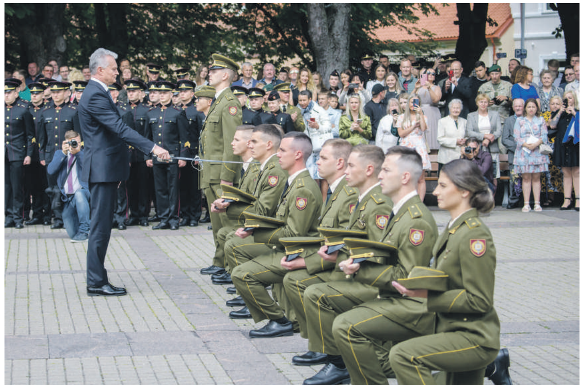
Pirmojo karininko – leitenanto – laipsnio suteikimo ceremonija.

Kas lemia apsisprendimą rinktis studijas karo akademijoje? „Noras tapti karininku kiekvienam