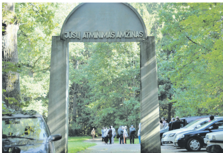
Žydų žudynių vieta Pivonijos šile.