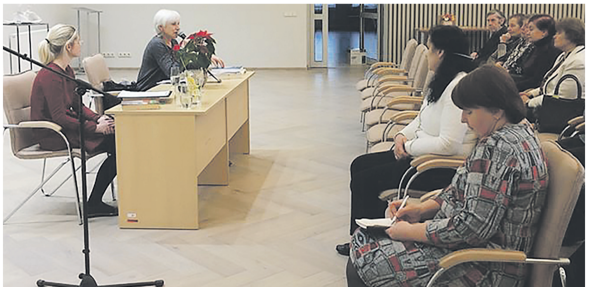
Susitikime su rašytoja Birute Jonuškaite.