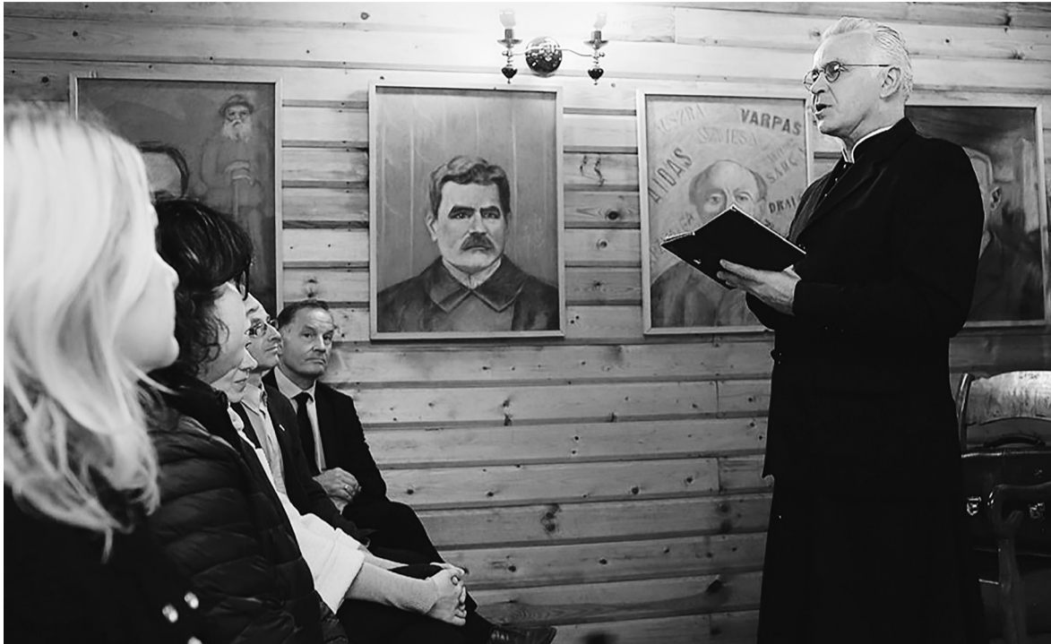
Akimirka iš spektaklio.