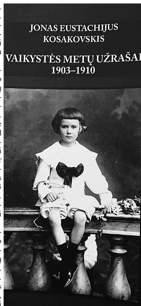
Išleista atsiminimų knyga.

Vaitkuškio rūmai buvo statomi 1857–1862 m. Rūmų statybos metu S. K. Kosakovskui talkino architektas B. Pavlovskis. Rezidencija buvo neogotikinio stiliaus, dviejų aukštų, su 3 aukštais anglių gotikos stiliaus bokštais. Ji atrodė turtingai ir prašmatniai. Bokštai ir sienos puošti kuorais. Rūmų langai, angos ir apvadai anglių gotikos stiliaus. Antrojo pasaulinio karo metais