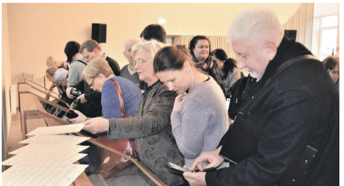
Lankytojai apžiūri spaudinius.