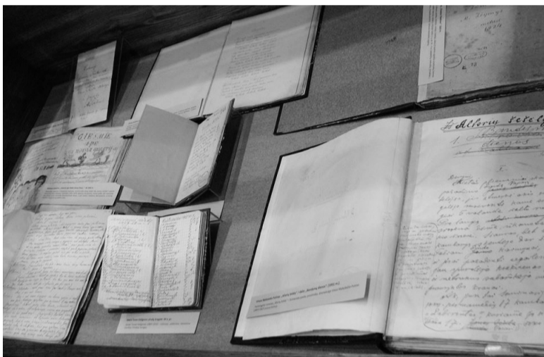
Bibliotekoje eksponuojamas dokumentinis paveldas.

Parodos lankytojai taip pat turėjo galimybę savo rankose palaikyti Martyno Mažvydo knygos „Katakizmas“ kopiją, kuri praktiškai nesiskiria nuo originalo – kopija, kaip ir originalas, susiūta netolygiai, galima apčiuopti jos popieriaus faktūrą bei pergamento netolygumus.