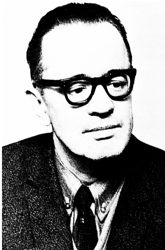
Vladas Šlaitas portretas.