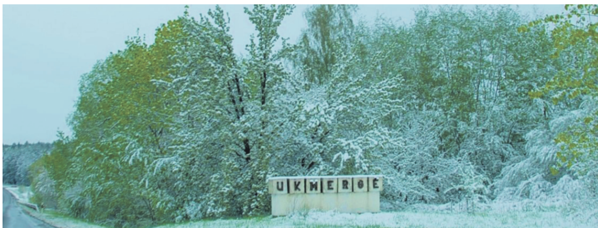
Ukmergė turi įdomią ir prasmingą istoriją.