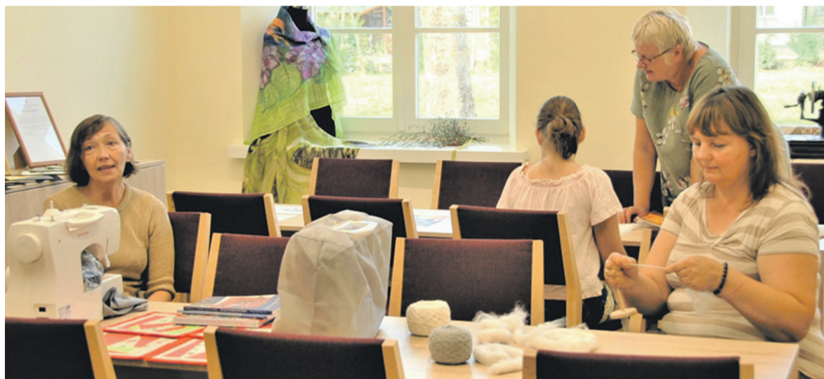
Tekstilės klasėje – įvairūs užsiėmimai.