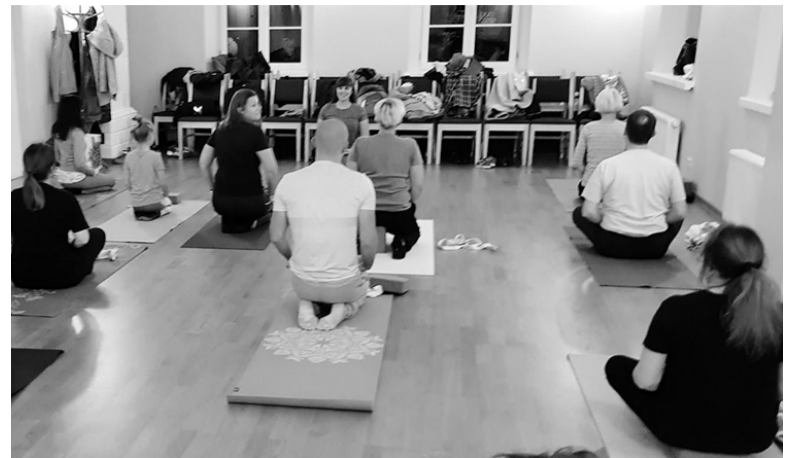
Salėje vyksta įvairūs fizinio aktyvumo užsiėmimai.

Tolerancijos centro kiemyje atidarymo metu lankytojai galėjo užsisakyti jame išaugusių ažuoliukų daigų – tris dešimtmečius čia žaliuojančio korėjietiško ažuolo sodinukų. 2019 metų Miesto šventės metu buvo įsikūrusios jaunimo veiklos. Vyko mandalų piešimas, tapyba ant vandens, svečiai buvo vaišinami turkiška kava.