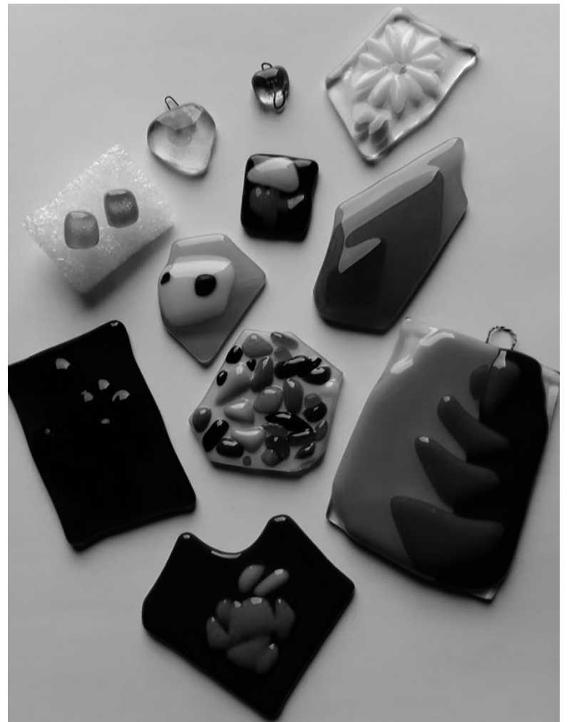
Centre galima pasigaminti suvenyrų iš stiklo.