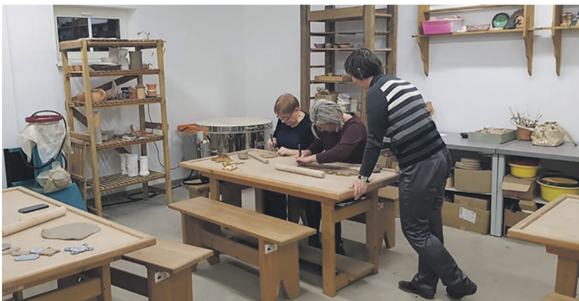
Atskiroje patalpoje įrengtos keramikos dirbtuvės.