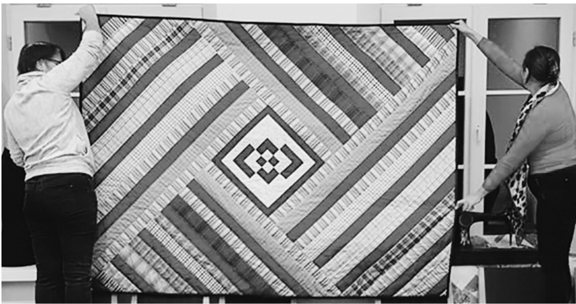
Moterys demonstruoja tekstilės darbus.