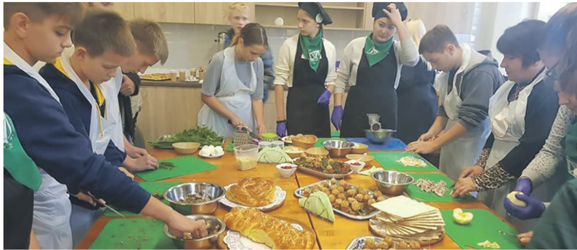
Vyko litvakų tradicinių patiekalų pristatymas.