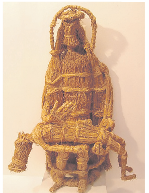
G. Gavenavičiaus kūriniai.