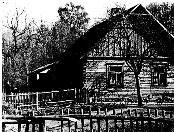
Eigilio gyvenamasis namas buvusiam Gelučių kaime.