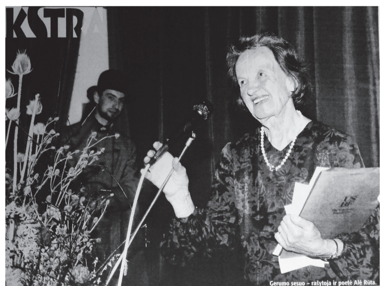
Nuotrauka iš Vlado Šlaito viešojoje bibliotekoje eksponuojamos parodos.