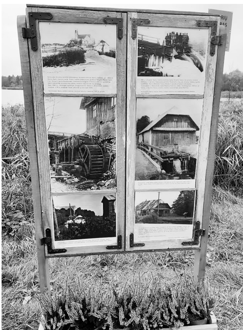
Vepriai mūsų rajone išsiskiria mažųjų meninių objektų gausa ir gamtos turtais.