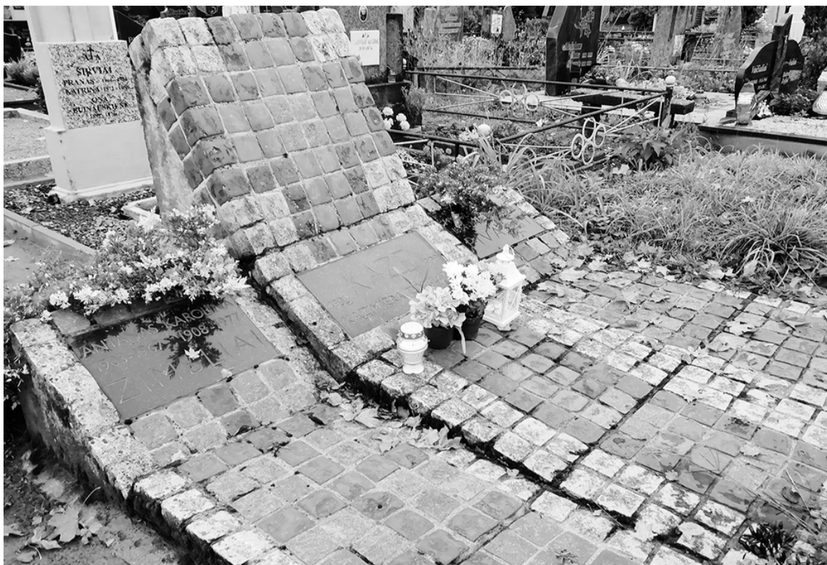
K. Zimblytės kapas.