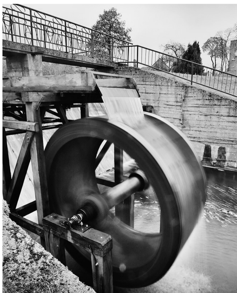
Dar vienas traukos objektas Vepriuose.